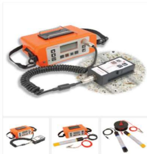
Máy siêu âm đường kính cốt thép