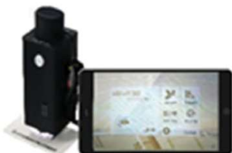
Máy siêu âm chiều rộng vết nứt