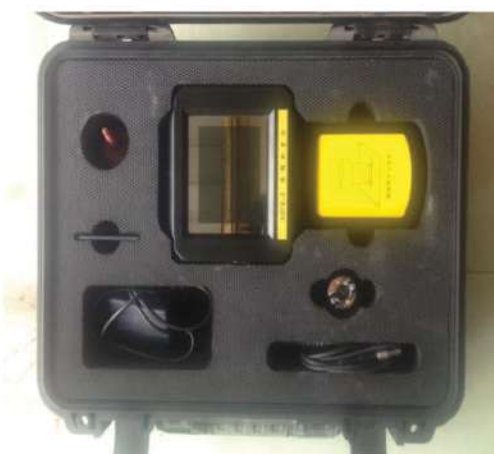
Máy siêu âm chiều rộng vết nứt