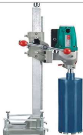
Máy khoan lấy lõi bê tông