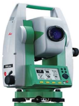
Máy toán đạc điện tử đo nghiêng, vồng