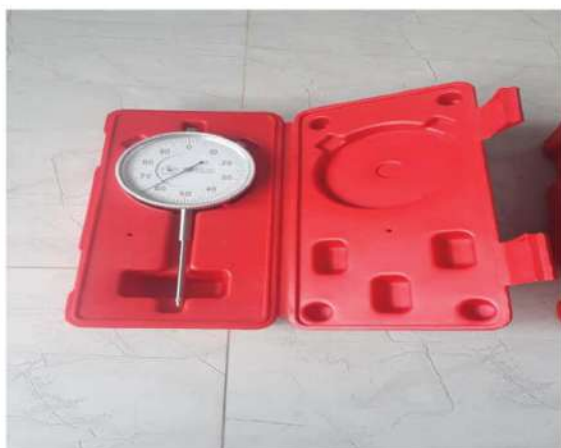
Đồng hồ so để thử tải sàn