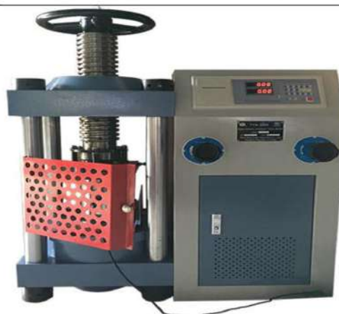
Máy nén kiểm tra cường độ bê tông