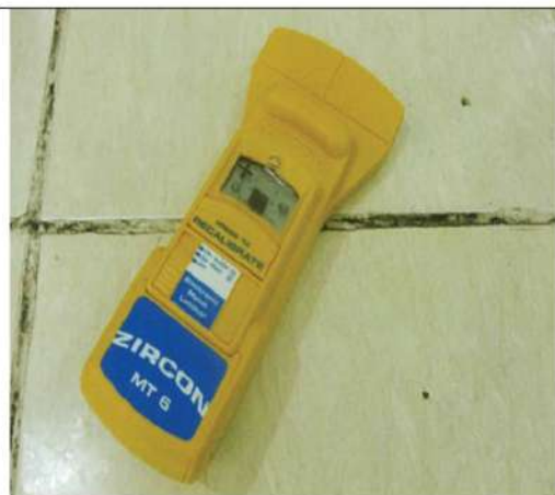
Máy siêu âm xác định vị trí thép