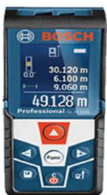
Máy đo khoảng cách