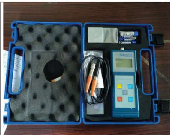
Máy đo siêu âm chiều dày lớp sơn, xi mạ