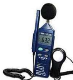
Máy đo độ ồn, nhiệt độ, độ ẩm, ánh sáng