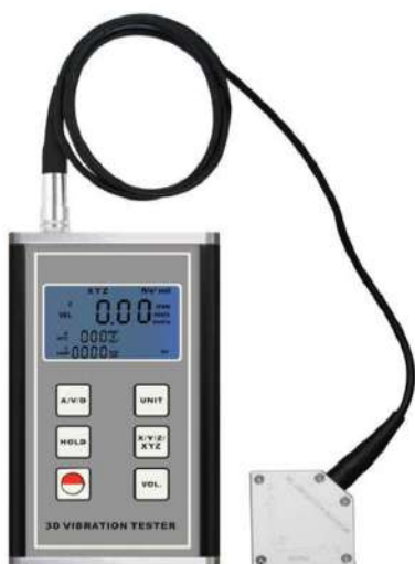
Máy đo độ rung sàn 3 chiều