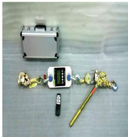
Máy đo lực căng dây cáp