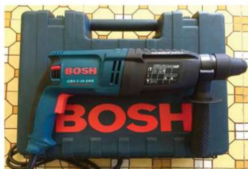
Máy khoan tay