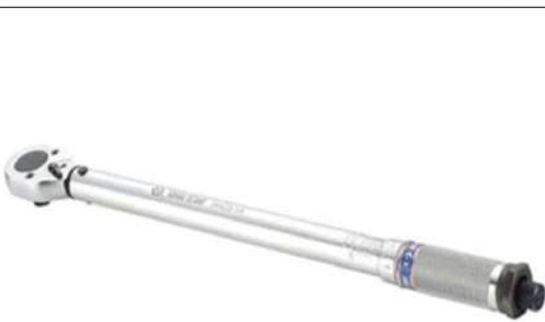
Cờ lê lực 1000 Nm kiểm tra lực siết bu lông