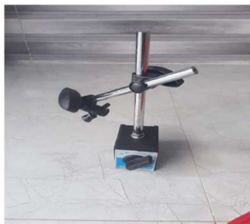
Cục hít từ để thử tải sàn