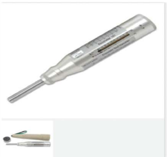
Súng kiểm tra cường độ bê tông