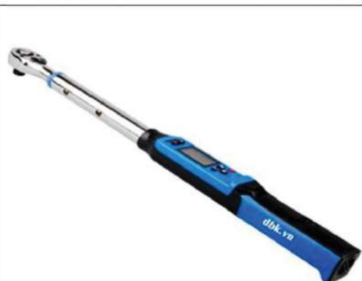
Cờ lê lực 135 Nm kiểm tra lực siết bu lông