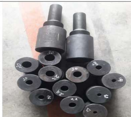
Bộ ngàm kiểm định cường độ bu lông