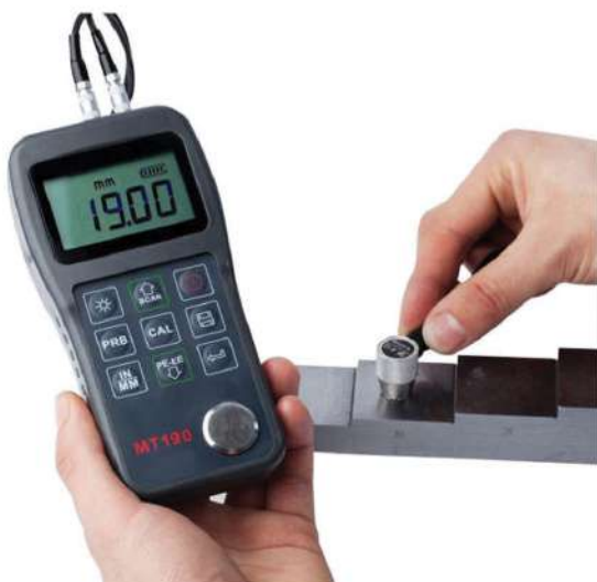
Máy siêu âm chiều thép tấm, thép hình